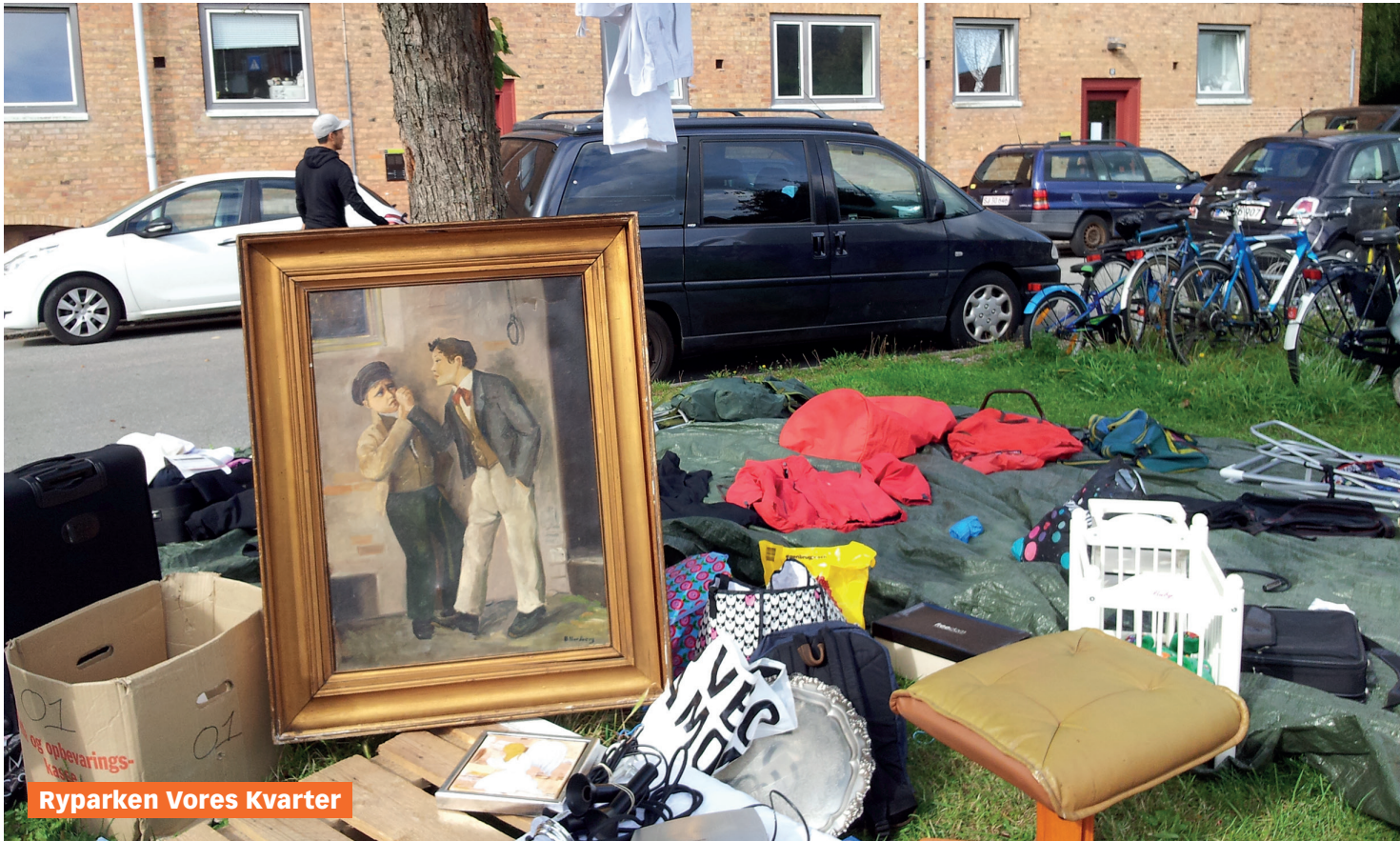
Ryparken Vores Kvarter