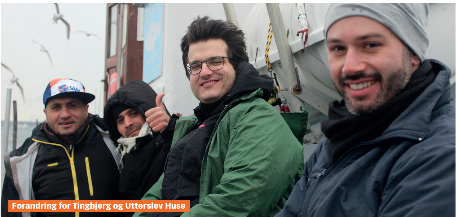
Forandring for Tingbjerg og Utterslev Huse