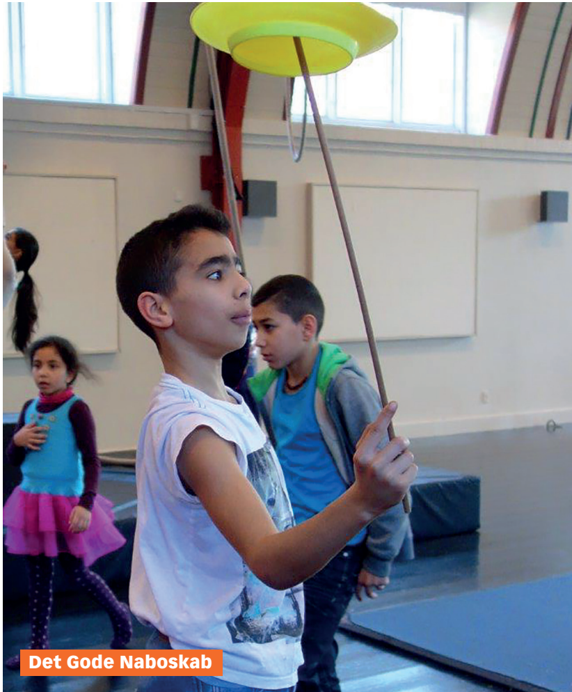
Det Gode Nabolag