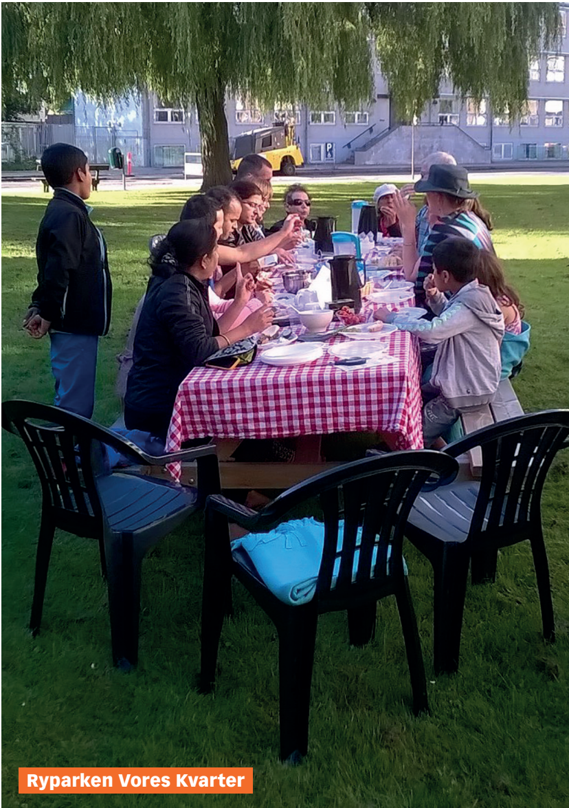
Ryparken Vores Kvarter