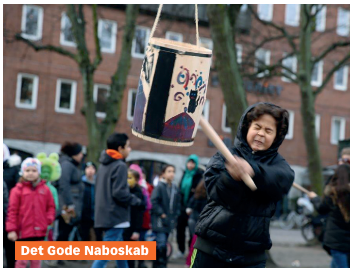
Det Gode Naboskab