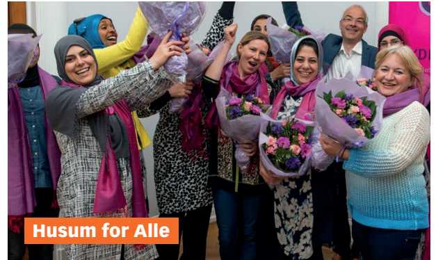
Husum for Alle