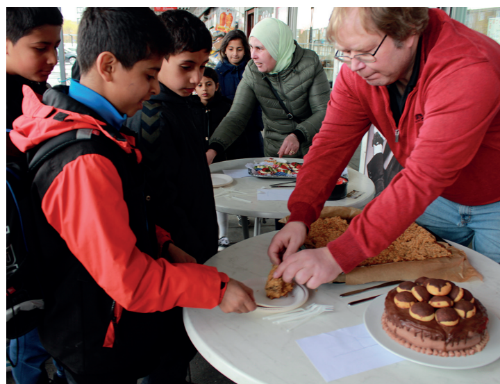
Forandring for Tingbjerg og Utterslev Huse

nede temaer 'tryghed' og 'forebyggelse af negativ social arv', og der kan arbejdes med følgende indsatsområder: