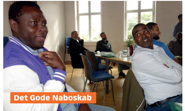
Det Gode Nabolikab